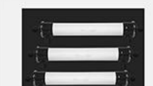
型号 : 6040 尺寸 Size : Ø150×1420mm 流量 Flow : 4T/h 工作压力 Working pressure : 0.1-0.4MPa 接口Connector : DN40