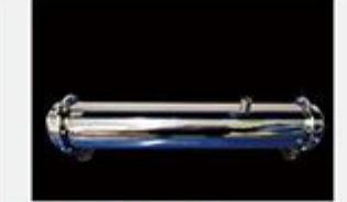
型号 : MAX-C-M36 尺寸 Size : Ø102×610mm 流量 Flow : 15L/min 工作压力 Working pressure : 0.1-0.4MPa Customizable size