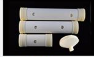
型号 : MAX-C-M35 尺寸 Size : Ø90×420mm Flow : 15L/min 工作压力 Working pressure :0.1-0.4MPa Customizable size