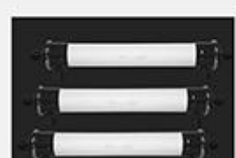
型号 : 6040 尺寸 Size : Ø150×1420mm 流量 Flow : 4T/h 工作压力 Working pressure :0.1-0.4MPa 接口Connector : DN40