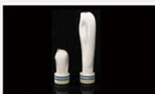
型号 : MAX-B-M15

尺寸 Size : Ø30×185mm 流量 Flow : 500-2000ml/min 工作压力 Working pressure : 0.1-0.4MPa