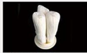
型号 : MAX-C-M34 尺寸 Size : Ø125×250/500mm 流量 Flow : 20L/min 40L/min 工作压力 Working pressure :0.1-0.4MPa