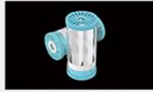
型号 : MAX-C-M33(10" ) 尺寸 Size : Ø117×254mm 流量 Flow : 10-15L/min 工作压力 Working pressure :0.1-0.4MPa