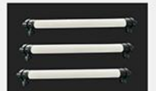
型号 : 4040 尺寸 Size : Ø90×1210mm 接口 Connector : Ø32 , DN25 流量 Flow : 1T/h 工作压力 Working pressure :0.1-0.4MPa