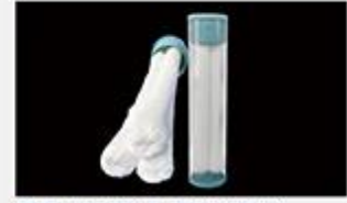
型号 : MAX-C-M33(20" ) 尺寸 Size : Ø117×510mm 流量 Flow : 25-30L/min 工作压力 Working pressure :0.1-0.4MPa