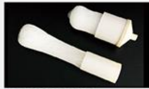
型号 : MAX-C-M32 尺寸 Size : Ø90×200/250/300/400/500mm 流量 Flow : 10-30L/min 工作压力 Working pressure :0.1-0.4MPa