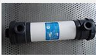
型号 : 4021 尺寸 Size : Ø90×500mm 接口 Connector : Ø32 , DN25 流量 Flow : 480L/h 工作压力 Working pressure :0.1-0.4MPa