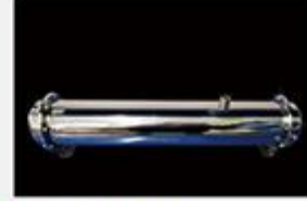
型号 : MAX-C-M36 尺寸 Size : Ø102×610mm 流量 Flow : 15L/min 工作压力 Working pressure :0.1-0.4MPa Customizable size