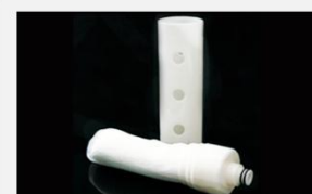
型号 : MAX-B-M29 尺寸 Size : \text{Ø}60 \times 218\text{mm} 流量 Flow : 2000-8000ml/min 工作压力 Working pressure : 0.1-0.4MPa 可用PS、PVDF膜丝 PS/PVDF fiber