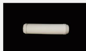
型号 : MAX-B-M30(10" ) 尺寸 Size : \text{Ø}65 \times 250\text{mm} 流量 Flow : 3000-10000ml/min 工作压力 Working pressure : 0.1-0.4MPa 可用PS、PVDF膜丝 PS/PVDF fiber