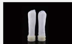
型号 : MAX-B-M18 尺寸 Size : \text{Ø}51 \times 200\text{mm} 流量 Flow : 2000-4000ml/min 工作压力 Working pressure : 0.1-0.4MPa 可用PS、PVDF膜丝 PS/PVDF fiber