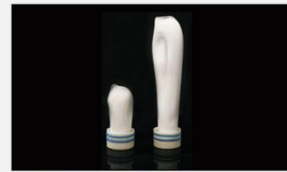
型号 : MAX-B-M15 尺寸 Size : \text{Ø}41 \times 100/200\text{mm} 流量 Flow : 1000-4000ml/min 压力 Pressure : 0.1-0.4MPa 可用PS、PVDF膜丝 PS/PVDF fiber