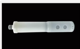
型号 : MAX-F-M5 尺寸 Size : Ø44×250mm 流量 Flow : 1000-4000ml/min 压力 Pressure :0.1-0.4MPa 前段 : 炭棒/PP棉 Front section : carbon rod, PP cotton