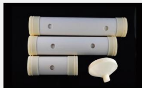
型号 : MAX-C-M35 尺寸 Size : \text{Ø}90 \times 420\text{mm} Flow : 15L/min 工作压力 Working pressure : 0.1-0.4MPa Customizable size