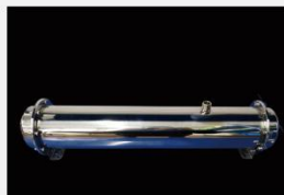
型号 : MAX-C-M36 尺寸 Size : \text{Ø}102 \times 610\text{mm} 流量 Flow : 15L/min 工作压力 Working pressure : 0.1-0.4MPa Customizable size