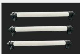
型号 : 4040 尺寸 Size : \text{Ø}90 \times 1210\text{mm} 接口 Connector : \text{Ø}32 , DN25 流量 Flow : 1T/h 工作压力 Working pressure : 0.1-0.4MPa