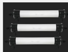
型号 : 6040 尺寸 Size : \text{Ø}150 \times 1420\text{mm} 流量 Flow : 4T/h 工作压力 Working pressure : 0.1-0.4MPa 接口 Connector : DN40