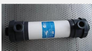
型号 : 4021 尺寸 Size : \text{Ø}90 \times 500\text{mm} 接口 Connector : \text{Ø}32 , DN25 流量 Flow : 480L/h 工作压力 Working pressure : 0.1-0.4MPa