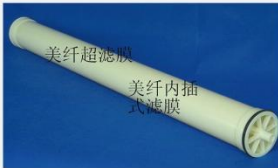
型号 : 4040 尺寸 Size : \varnothing 90 \times 1110 mm 流量 Flow : 1T/h 工作压力 Working pressure : 0.1-0.4MPa