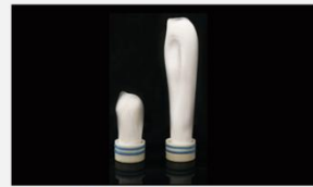
型号 : MAX-B-M15 尺寸 Size : \text{Ø}41 \times 100/200\text{mm} 流量 Flow : 1000-4000ml/min 压力 Pressure : 0.1-0.4MPa 可用PS、PVDF膜丝 PS/PVDF fiber