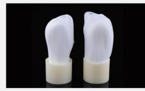
型号 : MAX-B-M12 尺寸 Size : \varnothing 25 \times 110 mm 流量 Flow : 500-2000ml/min 工作压力 Working pressure : 0.1-0.4MPa