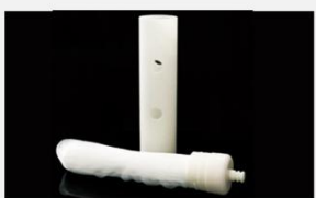
型号 : MAX-B-M28 尺寸 Size : \text{Ø}60 \times 253\text{mm} 流量 Flow : 2000-8000ml/min 工作压力 Working pressure : 0.1-0.4MPa 可用PS、PVDF膜丝 PS/PVDF fiber