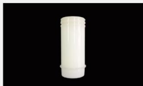
型号 : MAX-O-M1 尺寸 Size : \varnothing 30 \times 68 mm 流量 Flow : 1000-4000ml/min 工作压力 Working pressure : 0.1-0.4MPa