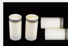
型号 : MAX-T-0011

尺寸 Size : \text{Ø}44 \times 134\text{mm} 流量 Flow : 3000-5000ml/min 工作压力 Working pressure : 0.1-0.7MPa