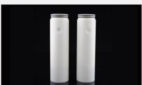
型号 : MAX-O-M6无盖系列 尺寸 Size : \varnothing 44 \times 134/156/180/200 mm 流量 Flow : 3000-5000ml/min 工作压力 Working pressure : 0.1-0.4MPa