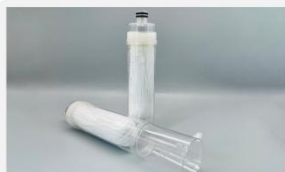
型号 : MAX-O-M9透明系列 尺寸 Size : \varnothing 44 \times 189/210/220/240 mm 流量 Flow : 2000-4000ml/min 工作压力 Working pressure : 0.1-0.4MPa 可于高温下使用 Can be used at high temperature