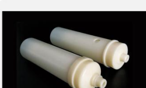
型号 : MAX-O-M10锁牙系列 尺寸 Size : \varnothing 44 \times 180/175 mm 流量 Flow : 2000-4000ml/min 工作压力 Working pressure : 0.1-0.4MPa 1/4" 螺纹 thread