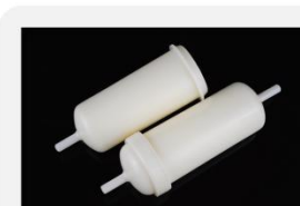
型号 : MAX-T-0003

尺寸 Size : \text{Ø}30 \times 87\text{mm} 流量 Flow : 1000-3000ml/min 工作压力 Working pressure : 0.1-0.4MPa