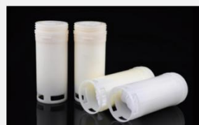
型号 : MAX-T-0053 尺寸 Size : \varnothing 47 \times 114 mm 流量 Flow : 4000-5000ml/min 工作压力 Working pressure : 0.1-0.4MPa