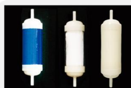
型号 : MAX-T-0001C

尺寸 Size : \text{Ø}40 \times 133\text{mm} 流量 Flow : 1000-4000ml/min 工作压力 Working pressure : 0.05-0.4MPa