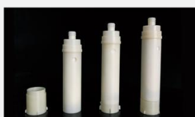
型号 : MAX-O-M7系列, 有插口 尺寸 Size : \varnothing 44 \times 189/210/220/240/250 mm 流量 Flow : 2000-4000ml/min 工作压力 Working pressure : 0.1-0.4MPa