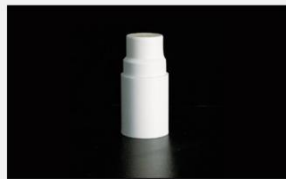
型号 : MAX-T-0029 尺寸 Size : \varnothing 28 \times 57 mm 流量 Flow : 200-1000ml/min 工作压力 Working pressure : 0.1-0.4MPa