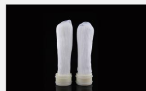
型号 : MAX-B-M18 尺寸 Size : \text{Ø}51 \times 200\text{mm} 流量 Flow : 2000-4000ml/min 工作压力 Working pressure : 0.1-0.4MPa 可用PS、PVDF膜丝 PS/PVDF fiber