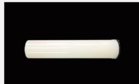
型号 : MAX-O-M3 尺寸 Size : \varnothing 34 \times 165 mm 流量 Flow : 2000-4000ml/min 工作压力 Working pressure : 0.1-0.4MPa