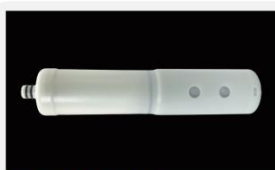
型号 : MAX-F-M6 尺寸 Size : \varnothing 60 \times 285 mm 流量 Flow : 2000-6000ml/min 压力 Pressure : 0.1-0.4MPa 前段 : 炭棒/PP棉 Front section : carbon rod, PP cotton