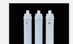
型号 : MAX-O-M8瓷白系列 尺寸 Size : \varnothing 44 \times 189/210 mm 流量 Flow : 2000-4000ml/min 工作压力 Working pressure : 0.1-0.4MPa