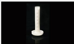
型号 : MAX-O-M34 尺寸 Size : \varnothing 21 \times 128 mm 流量 Flow : 100-1000ml/min 工作压力 Working pressure : 0.01-0.2MPa 碳棒内芯 Carbon rod filling