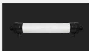
型号 : 8040 尺寸 Size : \varnothing 200 \times 1500 mm 流量 Flow : 8T/h 工作压力 Working pressure : 0.1-0.4MPa 接口 Connector : DN50