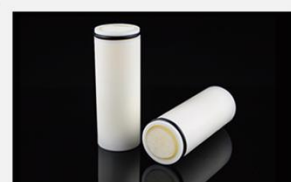
型号 : MAX-T-0008

尺寸 Size : \text{Ø}33 \times 84\text{mm} 流量 Flow : 500-3000ml/min 工作压力 Working pressure : 0.01-0.4MPa