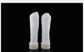
型号 : MAX-B-M16 尺寸 Size : \text{Ø}53 \times 200\text{mm} 流量 Flow : 2000-6000ml/min 工作压力 Working pressure : 0.1-0.4MPa 可用PS、PVDF膜丝 PS/PVDF fiber