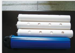
型号 : MAX-C-M31 尺寸 Size : \varnothing 63 \times 500 mm 流量 Flow : 10-20L/min 工作压力 Working pressure : 0.1-0.4MPa