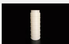
型号 : MAX-T-0009

尺寸 Size : \text{Ø}40 \times 110\text{mm} 流量 Flow : 1000-4000ml/min 工作压力 Working pressure : 0.1-0.4MPa