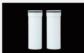
型号 : MAX-T-0060 尺寸 Size : \varnothing 30 \times 81 mm 流量 Flow : 1000-3000ml/min 工作压力 Working pressure : 0.1-0.4MPa