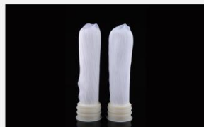
型号 : MAX-B-M17 尺寸 Size : \text{Ø}50 \times 200\text{mm} 流量 Flow : 2000-4000ml/min 工作压力 Working pressure : 0.1-0.4MPa 可用PS、PVDF膜丝 PS/PVDF fiber