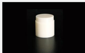
型号 : MAX-B-M1 尺寸 Size : \varnothing 32 \times 25 mm 流量 Flow : 200-2000ml/min 工作压力 Working pressure : 0.1-0.4MPa