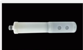
型号 : MAX-F-M5 尺寸 Size : \varnothing 44 \times 250 mm 流量 Flow : 1000-4000ml/min 压力 Pressure : 0.1-0.4MPa 前段 : 炭棒/PP棉 Front section : carbon rod, PP cotton