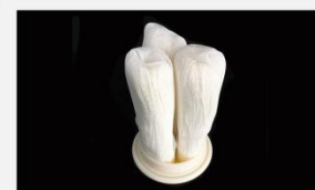
型号 : MAX-C-M34 尺寸 Size : \varnothing 125 \times 250/500 mm 流量 Flow : 20L/min 40L/min 工作压力 Working pressure : 0.1-0.4MPa