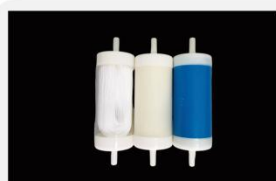
型号 : MAX-T-0001A

尺寸 Size : \text{Ø}40 \times 133\text{mm} 流量 Flow : 1000-4000ml/min 工作压力 Working pressure : 0.05-0.4MPa