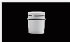
型号 : MAX-0.1-50B 尺寸 Size : \varnothing 57 \times 64 mm 组合 : 颗粒炭+离子交换树脂 Combination: Particle carbon + ion exchange resin 流量 Flow : 170-200ml/min 压力 : 无压自滴 Pressure: no pressure