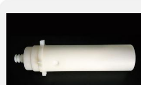
型号 : MAX-O-M11 尺寸 Size : \varnothing 44 \times 191 mm 流量 Flow : 2000-4000ml/min 工作压力 Working pressure : 0.1-0.4MPa