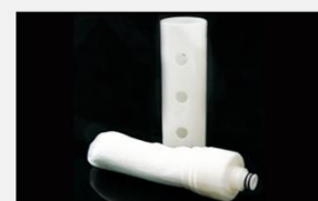
型号 : MAX-B-M29 尺寸 Size : \text{Ø}60 \times 218\text{mm} 流量 Flow : 2000-8000ml/min 工作压力 Working pressure : 0.1-0.4MPa 可用PS、PVDF膜丝 PS/PVDF fiber