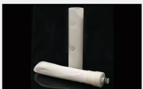
型号 : MAX-B-M27 尺寸 Size : \text{Ø}45 \times 235\text{mm} 流量 Flow : 2000-4000ml/min 工作压力 Working pressure : 0.1-0.4MPa 可用PS、PVDF膜丝 PS/PVDF fiber