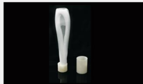
型号 : MAX-B-M14 尺寸 Size : \text{Ø}30 \times 185\text{mm} 流量 Flow : 500-2000ml/min 工作压力 Working pressure : 0.1-0.4MPa