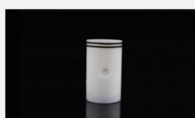
型号 : MAX-O-M5 尺寸 Size : \varnothing 44 \times 75 mm 流量 Flow : 1000-4000ml/min 工作压力 Working pressure : 0.1-0.4MPa