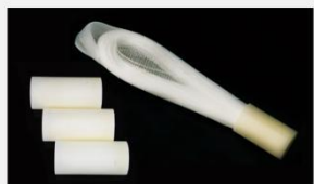
型号 : MAX-B-M13 尺寸 Size : \text{Ø}27 \times 200\text{mm} 流量 Flow : 500-2000ml/min 工作压力 Working pressure : 0.1-0.4MPa