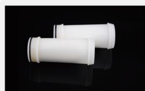
型号 : MAX-T-0004

尺寸 Size : \text{Ø}41 \times 115\text{mm} 流量 Flow : 1000-4000ml/min 工作压力 Working pressure : 0.05-0.4MPa