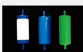
型号 : MAX-T-0001B

尺寸 Size : \text{Ø}40 \times 133\text{mm} 流量 Flow : 1000-4000ml/min 工作压力 Working pressure : 0.05-0.4MPa