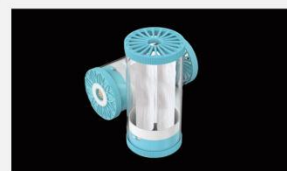
型号 : MAX-C-M33(10" ) 尺寸 Size : \varnothing 117 \times 254 mm 流量 Flow : 10-15L/min 工作压力 Working pressure : 0.1-0.4MPa