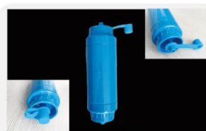
型号 : MAX-T-0001E

尺寸 Size : \text{Ø}40 \times 150\text{mm} 流量 Flow : 1000-4000ml/min 工作压力 Working pressure : 0.05-0.4MPa