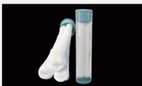
型号 : MAX-C-M33(20" ) 尺寸 Size : \varnothing 117 \times 510 mm 流量 Flow : 25-30L/min 工作压力 Working pressure : 0.1-0.4MPa