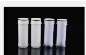
型号 : MAX-T-0002

尺寸 Size : \text{Ø}40 \times 85\text{mm} 流量 Flow : 1000-4000ml/min 工作压力 Working pressure : 0.05-0.4MPa 可乐瓶螺纹 Coke bottle female thread