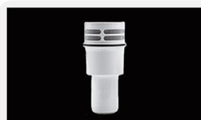
型号 : MAX-0.1-50 尺寸 Size : \varnothing 57 \times 119 mm 组合 : 颗粒炭+超滤膜 Combination: particle carbon+UF 流量 Flow : 100-200ml/min 压力 : 无压自滴 Pressure: no pressure