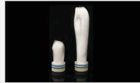
型号 : MAX-B-M15 尺寸 Size : \text{Ø}41 \times 100/200\text{mm} 流量 Flow : 1000-4000ml/min 压力 Pressure : 0.1-0.4MPa 可用PS、PVDF膜丝 PS/PVDF fiber