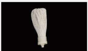
型号 : MAX-B-M35 尺寸 Size : \text{Ø}45 \times 200\text{mm} 流量 Flow : 2000-5000ml/min 工作压力 Working pressure : 0.1-0.4MPa 可用PS、PVDF膜丝 PS/PVDF fiber 1/4" 螺纹 thread