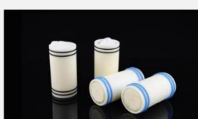
型号 : MAX-O-M4 尺寸 Size : \varnothing 40 \times 80 mm 流量 Flow : 1000-4000ml/min 工作压力 Working pressure : 0.1-0.4MPa