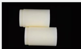
型号 : MAX-O-M2 尺寸 Size : \varnothing 44 \times 50/60/100/200 mm 流量 Flow : 1000/1200/2000/4000ml/min 工作压力 Working pressure : 0.1-0.4MPa