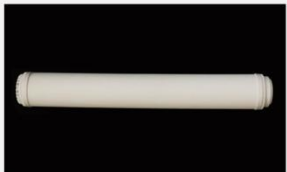
型号 : MAX-C-M30(20" ) 尺寸 Size : \varnothing 65 \times 500 mm 流量 Flow : 10-20L/min 工作压力 Working pressure : 0.1-0.4MPa