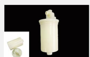
型号 : MAX-T-0005

尺寸 Size : \text{Ø}30 \times 80\text{mm} 流量 Flow : 1000-3000ml/min 工作压力 Working pressure : 0.1-0.4MPa