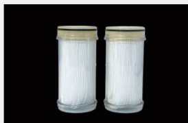
型号 : MAX-T-0021 尺寸 Size : \varnothing 37 \times 82 mm 流量 Flow : 1000-4000ml/min 工作压力 Working pressure : 0.1-0.4MPa