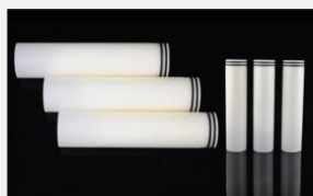
型号 : MAX-T-0043 尺寸 Size : \varnothing 36 \times 154 mm 流量 Flow : 2000-4000ml/min 工作压力 Working pressure : 0.1-0.4MPa