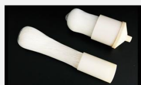
型号 : MAX-C-M32 尺寸 Size : \varnothing 90 \times 200/250/300/400/500 mm 流量 Flow : 10-30L/min 工作压力 Working pressure : 0.1-0.4MPa