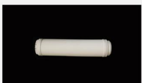
型号 : MAX-B-M30(10" ) 尺寸 Size : \text{Ø}65 \times 250\text{mm} 流量 Flow : 3000-10000ml/min 工作压力 Working pressure : 0.1-0.4MPa 可用PS、PVDF膜丝 PS/PVDF fiber