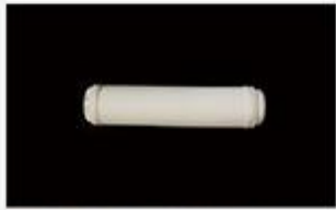
型号 : MAX-B-M30(10" ) 尺寸 Size : Ø65×250mm 流量 Flow : 3000-10000ml/min 工作压力 Working pressure : 0.1-0.4MPa 可用PS, PVDF膜丝 PS/PVDF fiber