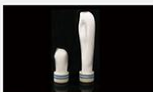
型号 : MAX-B-M15

尺寸 Size : Ø30×185mm 流量 Flow : 500-2000ml/min 工作压力 Working pressure : 0.1-0.4MPa