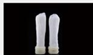
型号 : MAX-B-M16

尺寸 Size : Ø41×100/200mm 流量 Flow : 1000-4000ml/min 压力 Pressure : 0.1-0.4MPa 可用PS、PVDF膜丝 PS/PVDF fiber