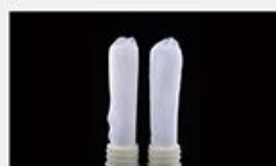
型号 : MAX-B-M17

尺寸 Size : Ø53×200mm 流量 Flow : 2000-6000ml/min 工作压力 Working pressure : 0.1-0.4MPa 可用PS、PVDF膜丝 PS/PVDF fiber