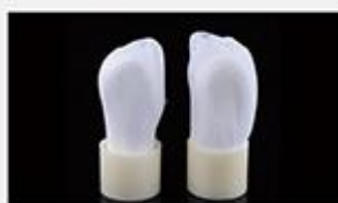
型号 : MAX-B-M12

尺寸 Size : Ø31×80mm 流量 Flow : 500-2000ml/min 工作压力 Working pressure : 0.1-0.4MPa