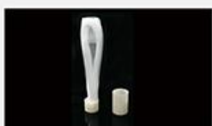
型号 : MAX-B-M14

尺寸 Size : Ø27×200mm 流量 Flow : 500-2000ml/min 工作压力 Working pressure : 0.1-0.4MPa