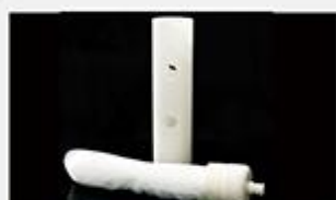
型号 : MAX-B-M28

尺寸 Size : Ø45×235mm 流量 Flow : 2000-4000ml/min 工作压力 Working pressure : 0.1-0.4MPa 可用PS、PVDF膜丝 PS/PVDF fiber