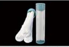
型号 : MAX-C-M33(20" ) 尺寸 Size : Ø117×510mm 流量 Flow : 25-30L/min 工作压力 Working pressure : 0.1-0.4MPa