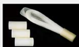
型号 : MAX-B-M13

尺寸 Size : Ø25×110mm 流量 Flow : 500-2000ml/min 工作压力 Working pressure : 0.1-0.4MPa