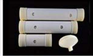
型号 : MAX-C-M35 尺寸 Size : Ø90×420mm Flow : 15L/min 工作压力 Working pressure : 0.1-0.4MPa Customizable size