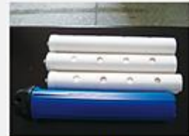
型号 : MAX-C-M31 尺寸 Size : Ø63×500mm 流量 Flow : 10-20L/min 工作压力 Working pressure : 0.1-0.4MPa