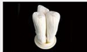
型号 : MAX-C-M34 尺寸 Size : Ø125×250/500mm 流量 Flow : 20L/min 40L/min 工作压力 Working pressure : 0.1-0.4MPa