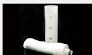
型号 : MAX-B-M29

尺寸 Size : Ø60×253mm 流量 Flow : 2000-8000ml/min 工作压力 Working pressure : 0.1-0.4MPa 可用PS、PVDF膜丝 PS/PVDF fiber