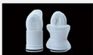
型号 : MAX-B-M11

尺寸 Size : Ø31×80mm 流量 Flow : 500-2000ml/min 工作压力 Working pressure : 0.1-0.4MPa