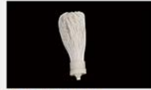
型号 : MAX-B-M35

尺寸 Size : Ø60×218mm 流量 Flow : 2000-8000ml/min 工作压力 Working pressure : 0.1-0.4MPa 可用PS、PVDF膜丝 PS/PVDF fiber