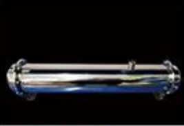
型号 : MAX-C-M36 尺寸 Size : Ø102×610mm 流量 Flow : 15L/min 工作压力 Working pressure : 0.1-0.4MPa Customizable size