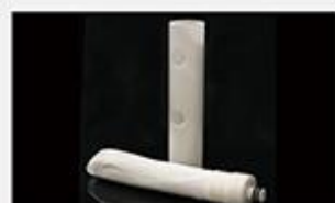
型号 : MAX-B-M27

尺寸 Size : Ø51×200mm 流量 Flow : 2000-4000ml/min 工作压力 Working pressure : 0.1-0.4MPa 可用PS、PVDF膜丝 PS/PVDF fiber