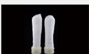
型号 : MAX-B-M18

尺寸 Size : Ø50×200mm 流量 Flow : 2000-4000ml/min 工作压力 Working pressure : 0.1-0.4MPa 可用PS、PVDF膜丝 PS/PVDF fiber